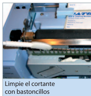
Limpié el cortante con bastoncillos