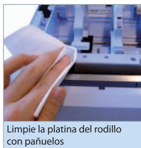
Limpié la platina del rodillo con pañuelos