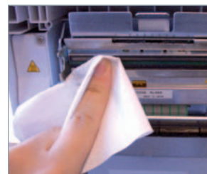
Limpié del cabezal con pañuelos