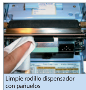
Limpié rodillo dispensador con pañuelos