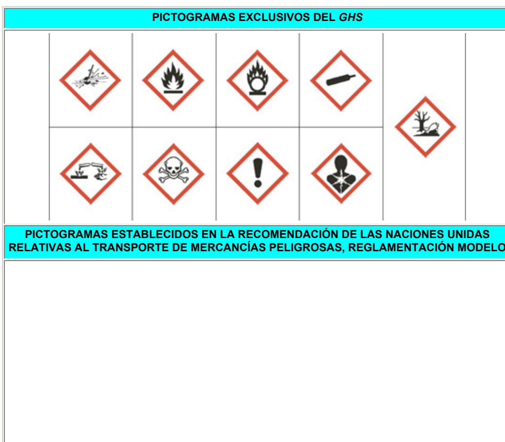
Figura 4 Pictogramas utilizados por el GHS

Parte de los símbolos de peligro que se presentan en la figura 4 fueron tomados de las Recomendaciones de las Naciones Unidas relativas al transporte de mercancías peligrosas.