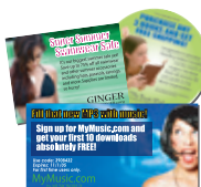
Message publicitaire personnalisé