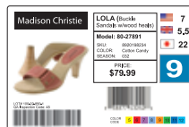
Identification du produit par l'image