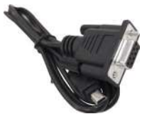
Adaptador USB a RS232 258238-001