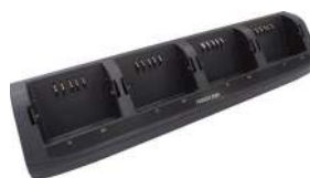
Cargador externo de baterías cuádruple de cuatro ranuras* 258234-001 Américas 258234-002 Europa 258234-003 Reino Unido