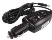
Adaptador de corriente del vehículo 258240-001