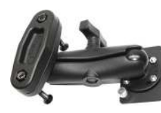
Adaptador para montacargas 258290-001