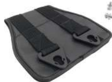
Pasador de velcro 258302-001