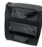
Protector de carcasa IP-54 (Caídas de hasta 1,8 m) 258152-001