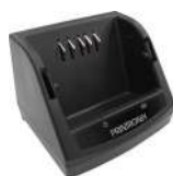
Cargador externo de baterías de ranura única* 258314-001 Américas 258314-002 Europa 258314-003 Reino Unido