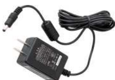
Cargador unitario CA* 258233-001 Américas 258233-002 Europa 258233-003 Reino Unido