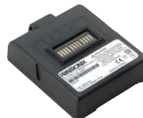
Batería de iones de litio 258235-001