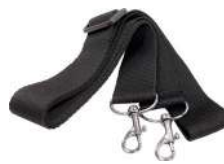
Correa para el hombro 258239-001