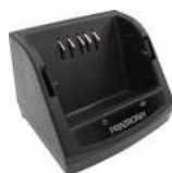
Chargeur de batterie externe à un seul logement* 258314-001 Amériques 258314-002 Europe 258314-003 Royaume-Uni