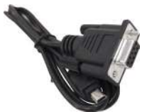
Adaptateur USB vers RS-232 258238-001