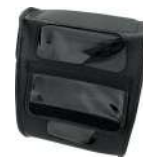
Housse de protection IP54 (pour les chutes jusqu'à 1,8 m) 258152-001