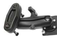
Kit de montage sur chariot élévateur 258290-001