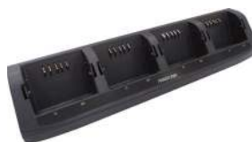
Chargeur de batterie externe à quatre logements* 258234-001 Amériques 258234-002 Europe 258234-003 Royaume-Uni