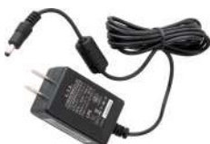
Chargeur secteur monobloc CA* 258233-001 Amériques 258233-002 Europe 258233-003 Royaume-Uni