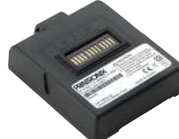
Batterie lithium-ion 258235-001