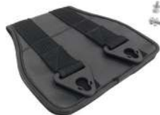
Support de ceinture Velcro 258302-001