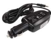
Chargeur allume-cigare 258240-001