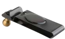
Clip pour ceinture en métal 258236-001